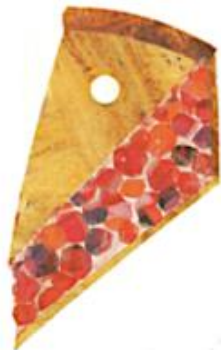
EUNE TARTE ÈS BADIES