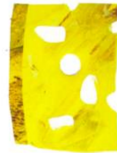
EUNE LICHE DE FOURMAIJE