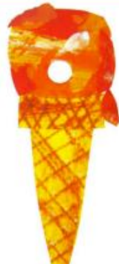
EUNE CORNETÉE DE GLLACE