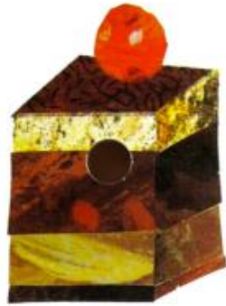
UN GÂTÈ AO CHICOLAT