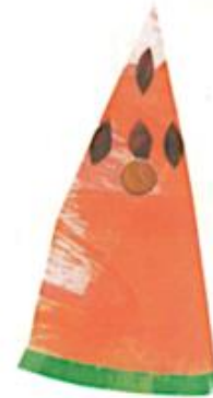
EUNE LICHE DE PASTEQUE