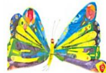
UN MIRABILLA DE PAPIVOLE