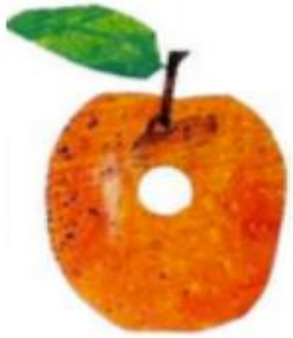
EUNE POME D'ORANJE