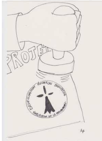
Regard subjectif sur l'innovation, Journée Académique