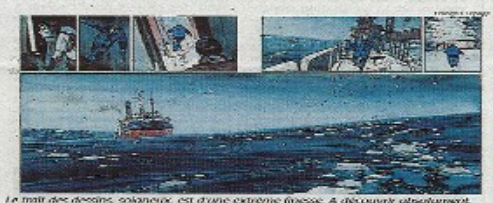
Le fait des dessins, soigné, est d'une extrême finesse. A découvrir absolument.

Après avoir travaillé en Afrique puis aux USA, François Lepage devient, en 2007, collaborateur de l'agence de photographie Sigma Press. Plusieurs grands projets marquent son parcours : une série de reportages sur les attitudes culturelles d'acceptation en Afrique (Musée de Bretagne), les Terres australes et les espaces protégés de France (RFI et Sénat, Jardin du Luxembourg, Paris), les Chemins de l'école posée par l'histoire (RFI, New York, Paris). Il est l'auteur de trois ouvrages sur les Terres australes et l'Antarctique.