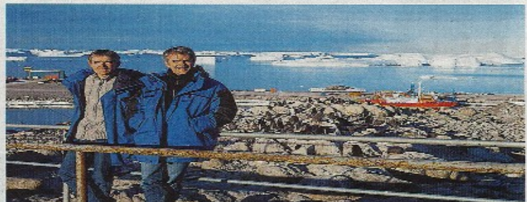
Pendant deux jours, ils chauffèrent pendant les 1.200 km qui séparent la base Concordia de la ville et montent jusqu'à 2.200 m d'altitude où la température est en moyenne, au cœur de l'hiver, à - 50° C. leur rêves d'explorateurs, comme si leurs aventures et leurs peurs de quinzaine leur tubulent aigres du fond de l'écriture. Ce sera alors l'aventure de leur vie ! Une rencontre à ne pas manquer, surtout pour les amoureux de voyages et de grands espaces.

« Aventure de leur vie » Mieux : François, le frère d'Emmanuel, reporter-photographe, sera aussi de la partie. Il en revient tous les deux, signer à quatre mains un livre mêlant photos et bande