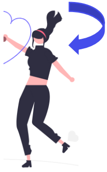
D'virer su gaoche / su drete