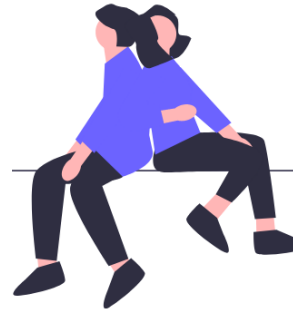
Païsser dôs contr dôs