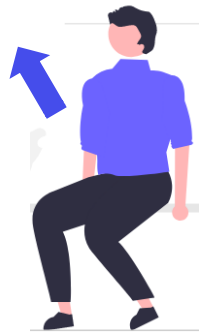
Se chomer (chome tai/chom'ous)