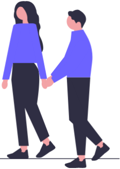
S'agerouer par deûz, par trouéz