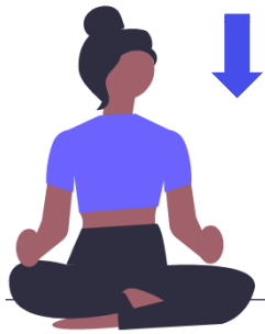
Se sieter (siete tai/siet'ous)