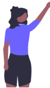
Haosser les pognes (pogne su la goule...)