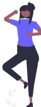
A cloche qhete