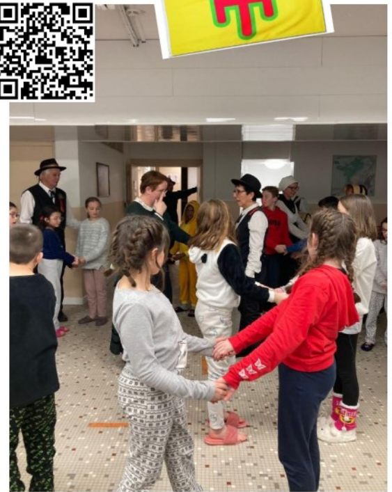
Des enfants dansent avec les Anciens

Pour les femmes, les jupes sont sombres, en laine, font 7cm d'épaisseur, et dessous, il a un jupon blanc. Elles ont un tablier : pour ramasser des légumes ou porter le bébé. Et les hommes portent des chaussures en bois, une belle chemise et un pantalon noir. Sur les chapeaux en paille, il y a un ruban aux trois couleurs de l'Auvergne, rouge comme la lave, jaune comme le soleil, vert comme la nature.