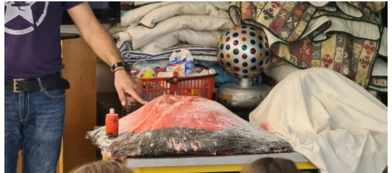
Maquette d'un volcan effusif