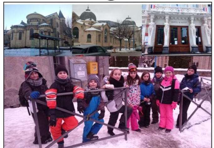
Un des groupes qui participaient au jeu d'orientation.

Les élèves étaient repartis par groupe de huit enfants avec un adulte qui les accompagnait. Voici quelques questions qui faisaient partie du jeu: « dans quelle région se trouve la Bourboule et plus précisément dans quel département, » « que fait-on dans un casino, quel âge doit-on avoir pour entrer dans une salle de jeux ? » « Quelles sont les principales affections qui sont soignées dans les grands thermes ? ». Tout s'est bien passé et personne ne s'est perdu !