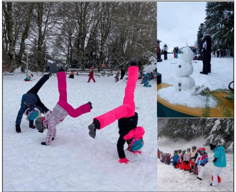
Les enfants qui s'amuse dans la neige.