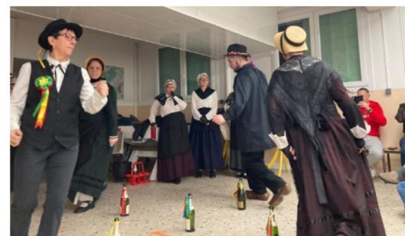
La danse des bouteilles