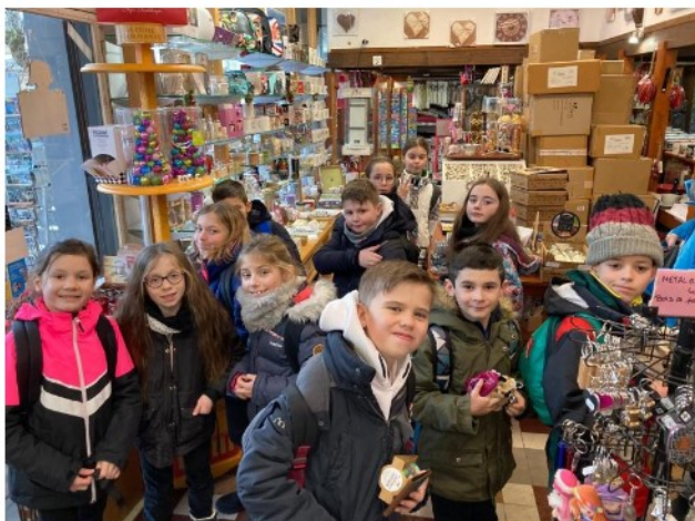
Les achats des élèves dans la Bourboule.

Les achats des CM1 et des CM2 ont eu lieu à 15 heures, avant le grand départ à 21 heures, le vendredi 3 février.