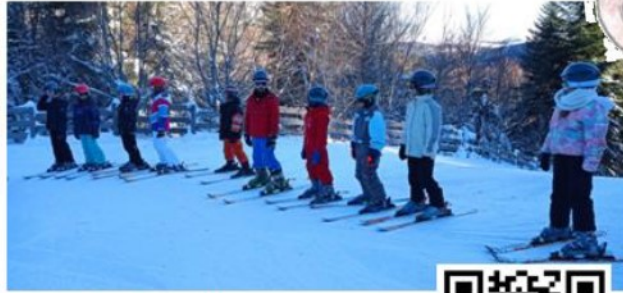
Les apprentis skieurs au Mont Dore

Les pistes de ski alpin se trouvaient au Mont Dore. Les 5 séances de ski avec les moniteurs ESF (Ecole de Ski Français) ont duré 4 jours, et ils leur ont appris à faire des dérapages, et du chasse-neige, des virages. Les élèves ont aussi pris des tire-fesses et des télésièges.