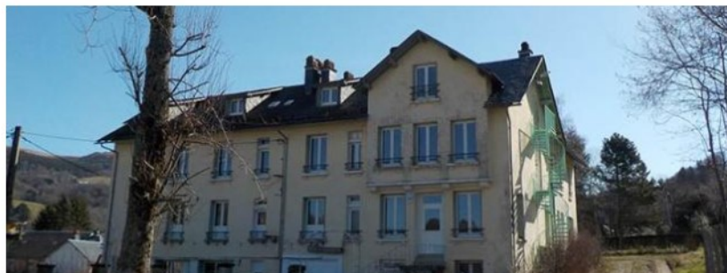
Le centre d'hébergement : les Cols des volcans

douze. Les chambres étaient composées de deux à six lits, et on avait beaucoup de salles de bains et de toilettes. Dans le sous-sol, il y avait trois salles : une petite pour les casiers des chaussures des filles, une autre pour les garçons, et dans l'autre salle des portemanteaux étaient disponibles, et sur une table il y avait plein de livres à disposition. Il y avait aussi un grand hall pour se réunir et faire les veillées. Au rez-de-chaussée, il y avait la cantine, les cuisines et le bureau de Christelle.