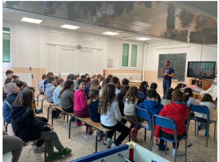
La « classe-volcans » dans la grande salle du centre.