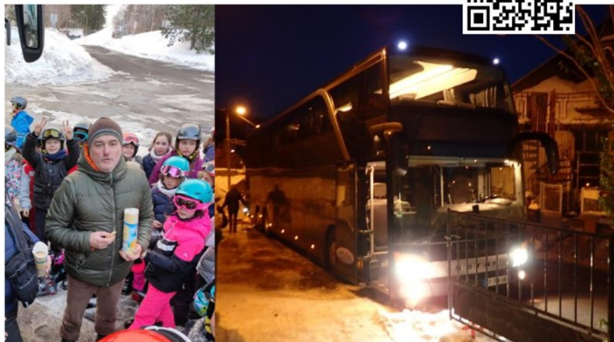
François, le chauffeur du car, qui distribue des goûters (à gauche) Le car double-étages au moment du départ (à droite)

Les CM1 CM2 de Boisgervilly sont partis le 29 janvier 2023 à 22h sur un parking en bas de l'école là où le car les attendait. Les élèves devaient donner leurs valises aux parents accompagnateurs pour les mettre dans la soute.