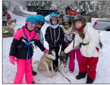
Les huskies sont des chiens qui sont à l'aise dans la neige.

Le mardi 31 janvier, le matin, tous les élèves ont pu découvrir les chiens de traîneau.