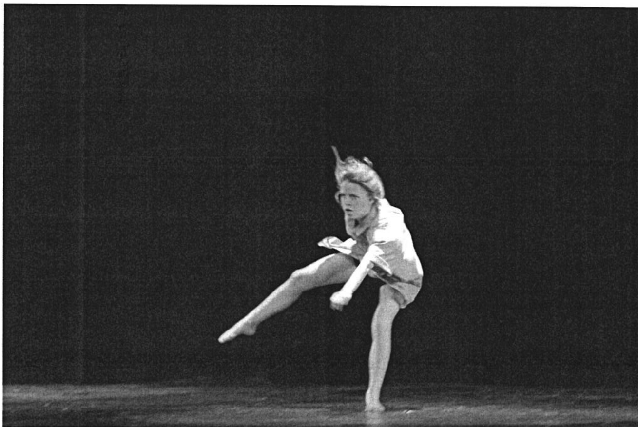
Élève de première du Lycée Bréquigny- Rennes- 2014