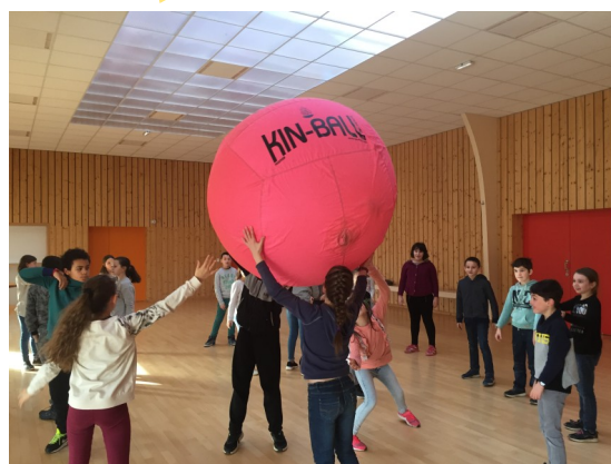
Entrainement dans la salle Ar Galon

Pour continuer l'apprentissage du Quidditch, nous jouons aussi au Kinball. Ce jeu est coopératif et se joue en équipes.