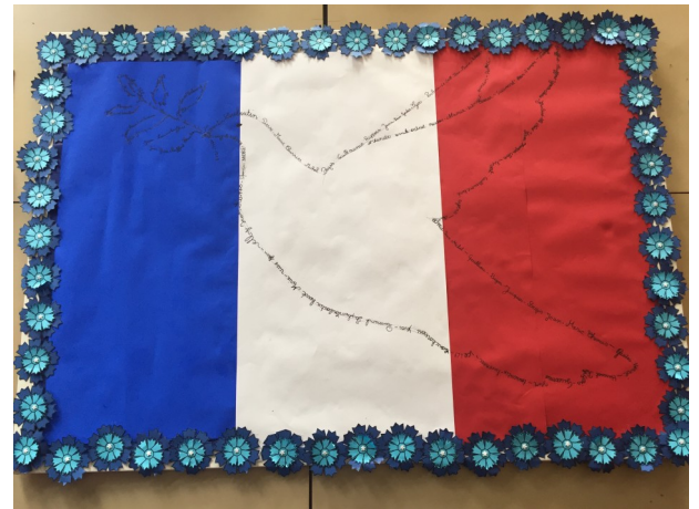
Réalisé par les CM1 et les CM2