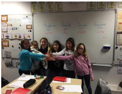
LES ÉLÈVES DE POUFSOUFFLE

Nous avons une bibliothèque de classe: on peut y trouver des livres sur les super héros, des Astrapi et des livres de la classe empruntés à la bibliothèque de Chateaulin.