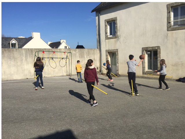
Entrainement dans la cour de l'ancienne école

Le sport que l'on pratique en classe est le Quidditch.