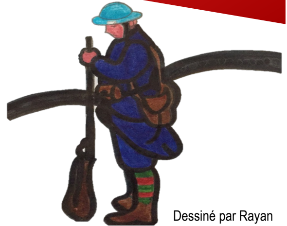
Dessiné par Rayan