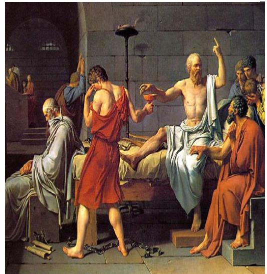
La Mort de Socrate, Jacques-Louis David , 1787.