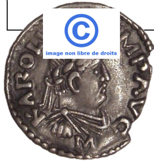
Charlemagne (monnaie vers 812)