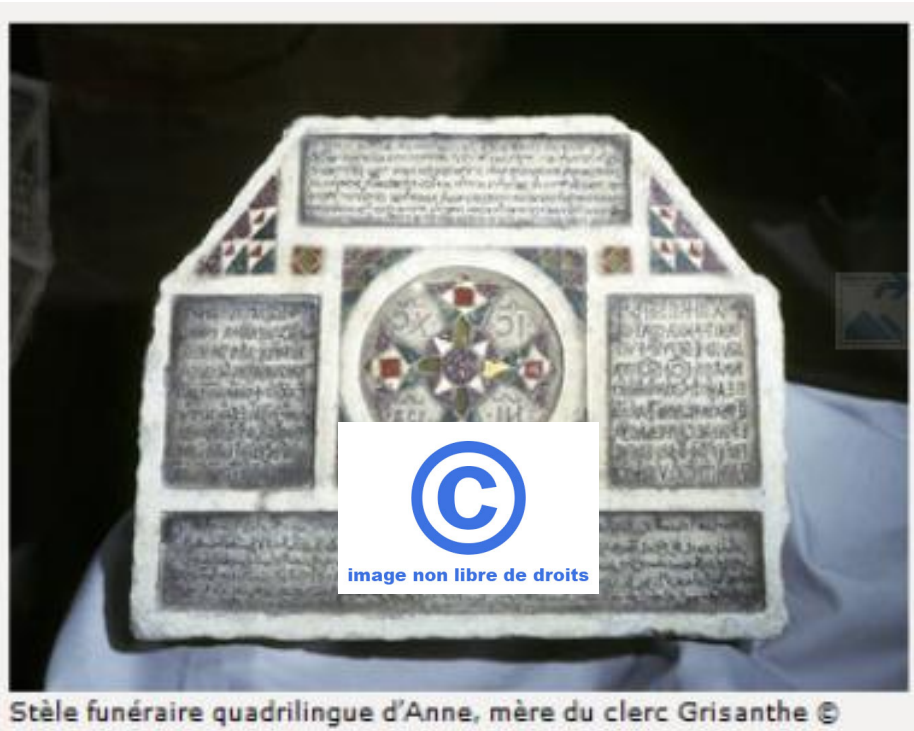
Stèle funéraire quadrilingue d'Anne, mère du clerc Grisanthe ©

Nature : Stèle funéraire quadrilingue d'Anne, mère du clerc Grisanthe