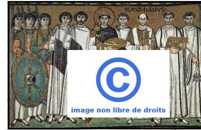
Justinien (mosaïque de Ravenne Milieu du VI ème siècle)