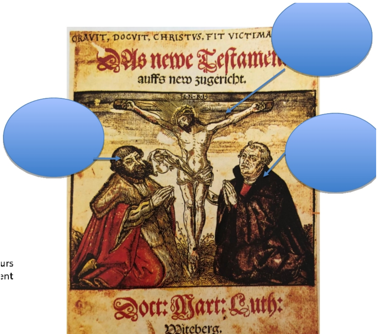
L'Évangile, Bible traduite en allemand par Luther, illustrations de Lucas Cranach, 1546, Wittenberg

Document 3 - Nicandre de Corfou, diplomate espagnol, Journal de voyage , 1546-1547