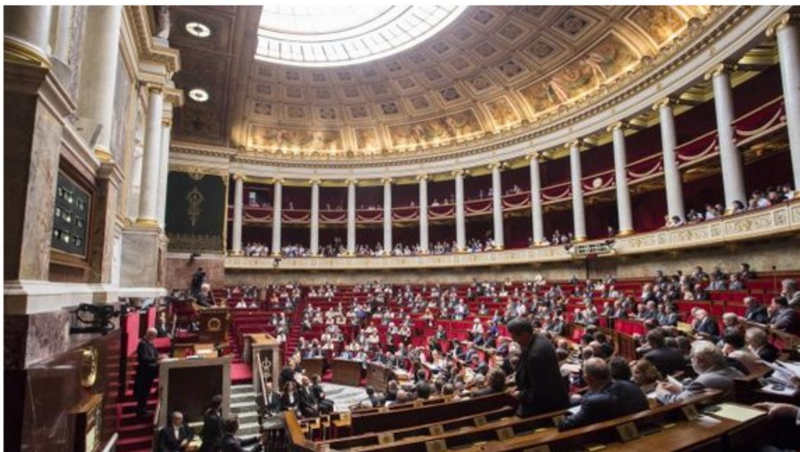
261 députés ont voté pour le texte présenté par le gouvernement (illustration)

Les députés ont voté pour le texte qui prévoit notamment de faire passer le nombre de régions françaises de 22 à 13, le report des élections régionales et départementales, et un "droit d'option" permettant aux départements de changer de région.