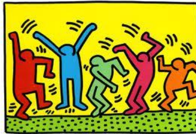
fresque murale de Keith Haring New-York