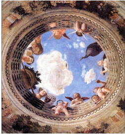
Mantegna, Faux oculus, la chambre des époux, 1473 Palais Ducal, Florence, Italie