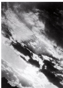
Alfred Stieglitz, Equivalent, série de photographie, 1925 - 1931