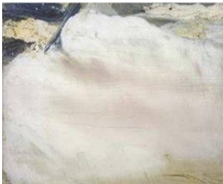
Olivier Debré, Grande blanche Touraine, 1973, huile sur toile, 189 x 309